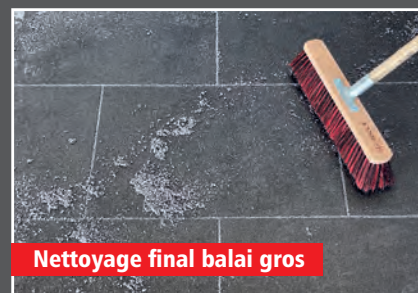
Nettoyage final balai gros