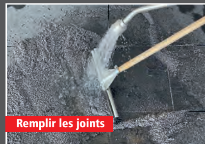
Remplir les joints